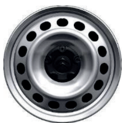
Kryt středu kol