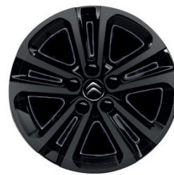
Hliníkový disk (celo-černý) STARLIT R16