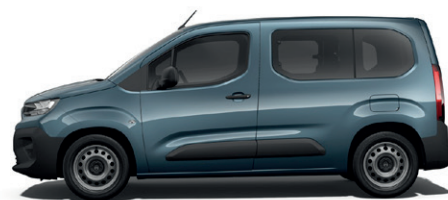
Modrá KIAMA (M)