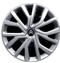
Okrasný kryt TWIRL R16 - černý střed