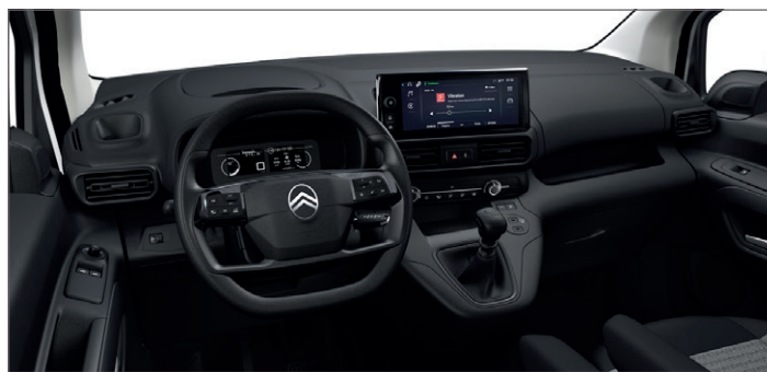
Interiér Látka LINE Šedá - OFFT